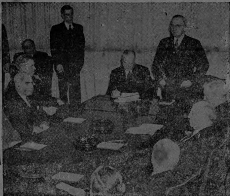
El Presidente Truman (de pie a la derecha) y el señor Hóover (sentado en el centro) en una conferencia sobre víveres celebrada en la Casa Blanca.

WASHINGTON. — Los Estados Unidos están haciendo preparativos para enviar, cuanto antes posible, embarques de granos con el fin de socorrer millones de personas que actualmente están sufriendo hambre debido a la carestía de víveres que se nota en casi todo el mundo. Se considera como medida esencial la comisión de emergencia para el suministro de víveres que se estableció recientemente. Esta comisión proporcionará trigo "para que millones de ciudadanos de países devastados por la guerra puedan librarse de la muerte, y sobrevivir la inanición." El Ex Presidente Herbert Hoover, es presidente honorario de dicha comisión.